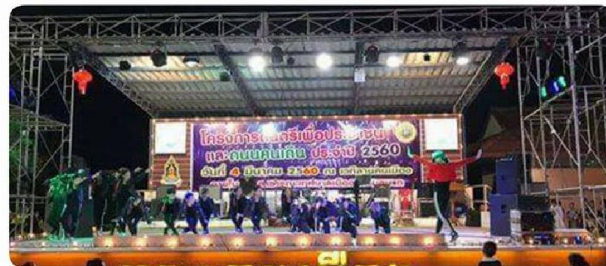
กิจกรรมดนตรีเพื่อประชาชนและถนนคนเดินประจำปี 2560